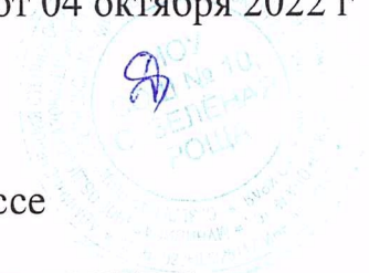
График диагностических работ в 11 классе

Приложение 1 к приказу №96/5-о/д от 04 октября 2022 г